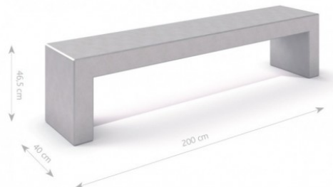
Rys. 1. Wymiary urządzenia

Przedstawione rysunki produktu mogą nieznacznie różnić się od rzeczywistego produktu.