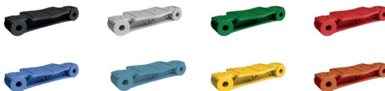
Rys. 3. Dostępna kolorystyka lamelek