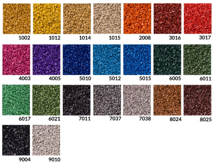
Rys. 4. Dostępna kolorystyka osłony trampoliny - EPDM