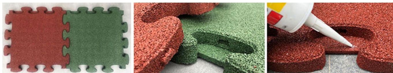
1. Tradycyjny kształt puzzla (12 wypustek)